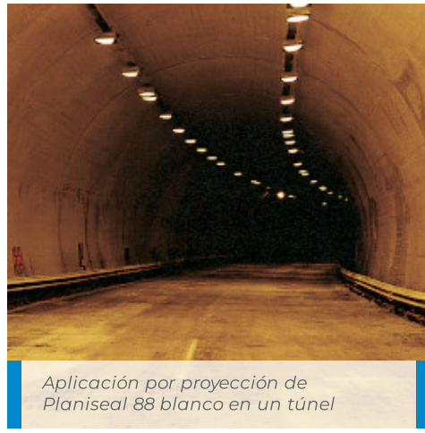
Aplicación por proyección de Planiseal 88 blanco en un túnel